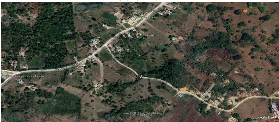
Grafica Nro. 4

La ubicación georreferencial del sitio intervenido se encuentra en la Zona Rural, Sampués, Sucre. Esta ubicación geográfica es de vital importancia para contextualizar el proyecto y comprender su impacto en la comunidad local.